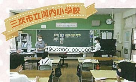
令和3年6月16日 / 7名 講師 / 榎原