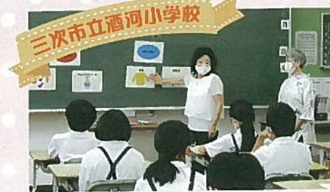
令和3年7月1日 / 28名 講師 / 島原 補助 / 和田