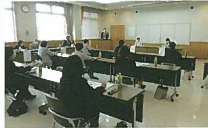
収支報告会の様子